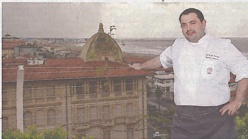
Lo chef sulla terrazza del ristorante che si affaccia sulla Passeggiata di Viareggio

“ La doppia stella è una grande soddisfazione e al tempo stesso anche una responsabilità. Ma è un segno di speranza e di fiducia per Viareggio